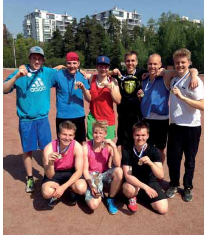
Lukion poikien voittoisa pesäpallojoukkue.