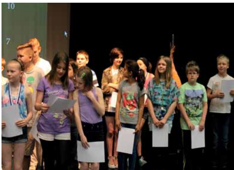
Alaluokkien kunniakirjat jaettiin 23.5.2014.