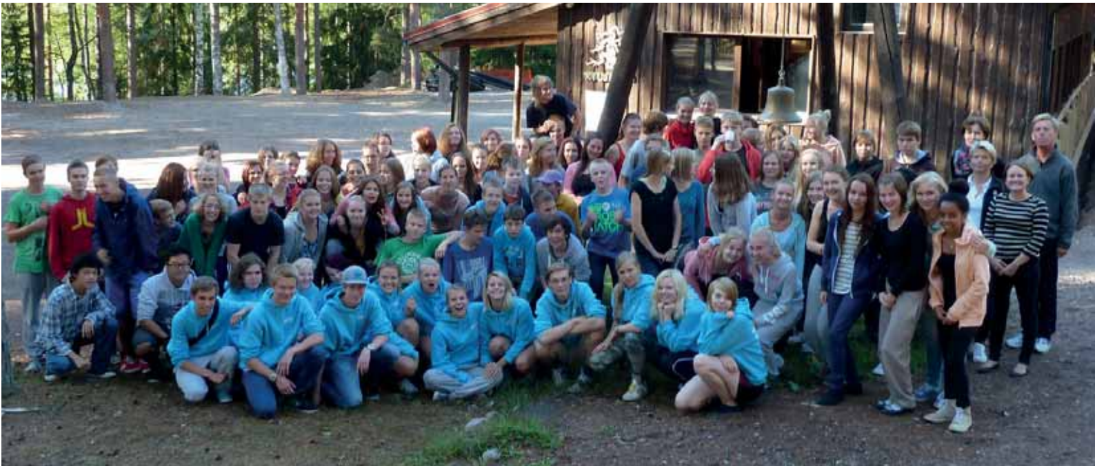
Tutorit ja lukion ykköset Kiljavan seminaarissa elokuussa 2013.